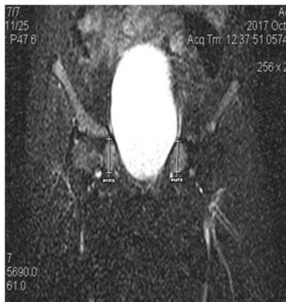
Figura 2. RMN de pelvis. Presencia de testis en ambos canales inguinales

Se observó ausencia de útero y anejos. Permeabilidad a nivel de los genitales externos,