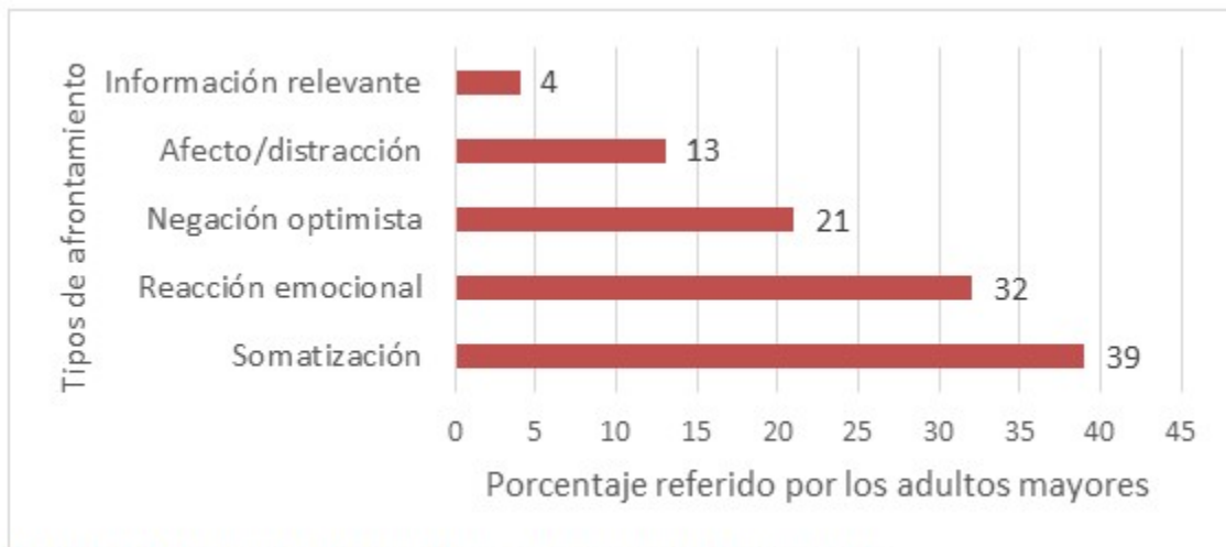
Gráfico 1. Distribución de los pacientes según los principales afrontamientos

En cuanto a la evaluación de la ejecución de la intervención educativa. Se registraron cambios en los estilos de afrontamiento, luego de la intervención. Este hecho que se relaciona con su efectividad. En la última sesión, en un 42 %, los adultos mayores se encaminaron hacia la búsqueda de información relevante, sin embargo, en la primera sesión, solo un 4 % habían movilizadado su comportamiento en este sentido.