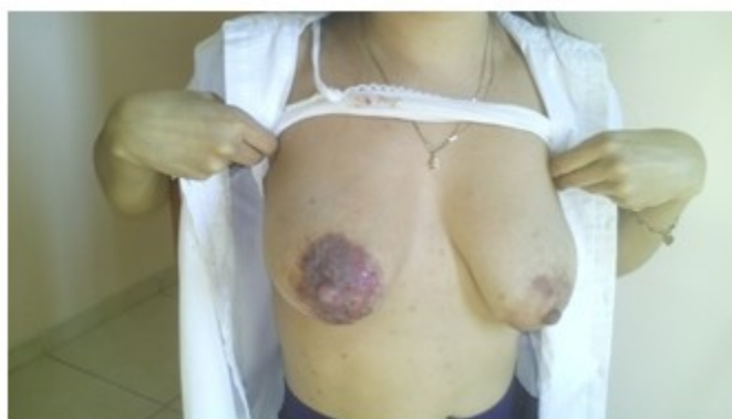
Fig. 2. Lesiones dérmicas en todo el complejo areola pezón derecho y lesiones comenzantes en la areola izquierda

areola en la mama izquierda. No se detectaron adenopatías axilares ni supraclaviculares. (Fig. 2).