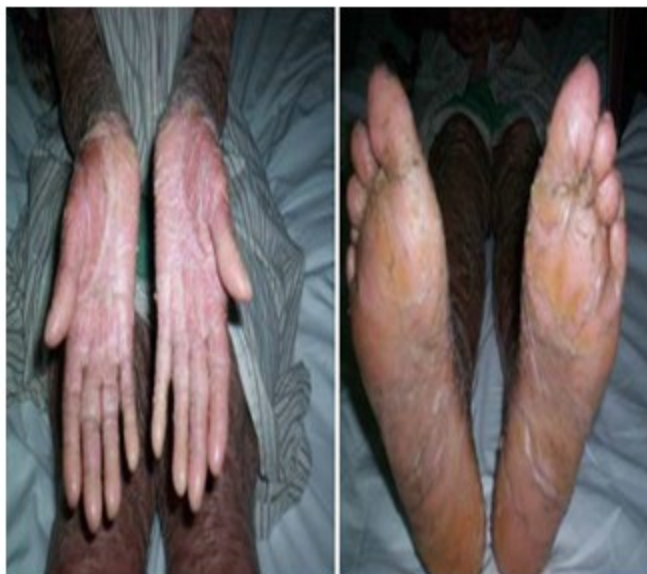
Figura 3. Se muestra la onicosis y la queratodermia

Hipoplasia de los pabellones auriculares, alopecia del cuero cabelludo, axila, pubis, cejas y pestañas de tipo cicatrizal. (Figura 4).