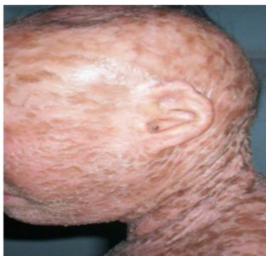
Figura 4. Se muestran otras imperfecciones

Hipoplasia de los pabellones auriculares, alopecia del cuero cabelludo, axila, pubis, cejas y pestañas de tipo cicatrizal. (Figura 4).