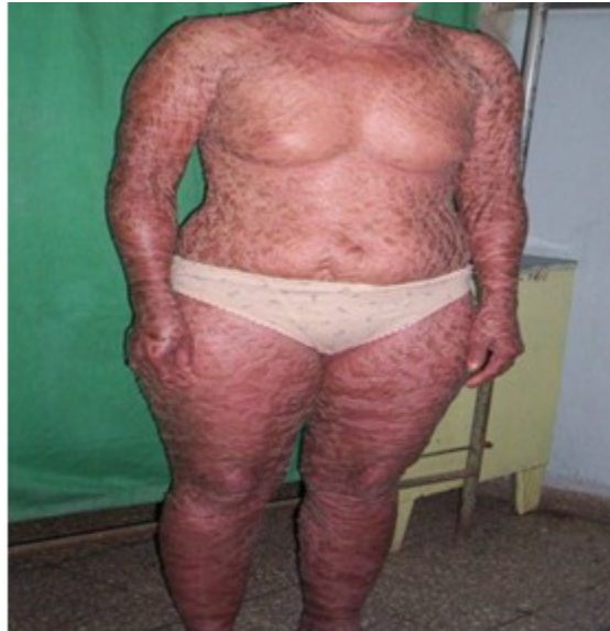
Figura 1. Se muestra la piel cubierta de escamas foliáceas

Además se observa nariz achatada, ectropión severo bilateral y protrusión dental. (Figura 2).