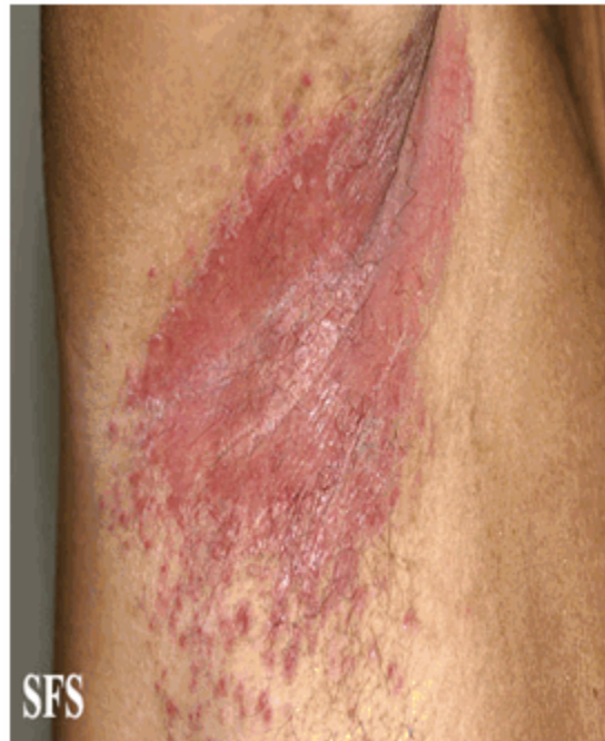
Figura 3. Lesiones eritematosas de bordes mal definidos en región axilar acompañadas de macerado blanquecino. Presencia de lesiones satélites