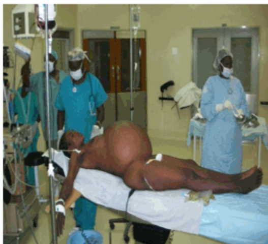
Figura 1. Paciente antes de la operación

En el ultrasonido transvaginal se confirmó una masa pélvica ecogénica que hacía cuerpo con el útero.