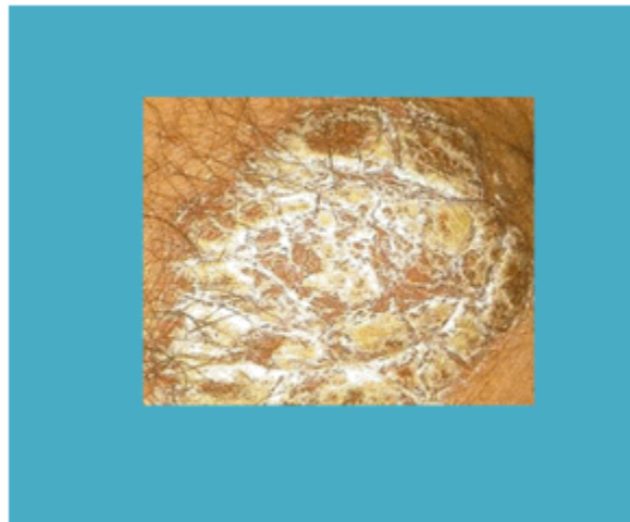
Figura 1. Placa eritematoescamosa en codos y rodillas

Las manifestaciones clínicas de la psoriasis vulgar están constituidas por eritemas de diferentes tonalidades, escamas blanconacaradas, friables, que forman placas de diferentes dimensiones, formas, localización y bordes precisos, con los característicos signos patognomónicos. Hay variedades de psoriasis especiales o complicaciones como son: variedad pustulosa, artropática y eritrodérmica. (Figura 1)