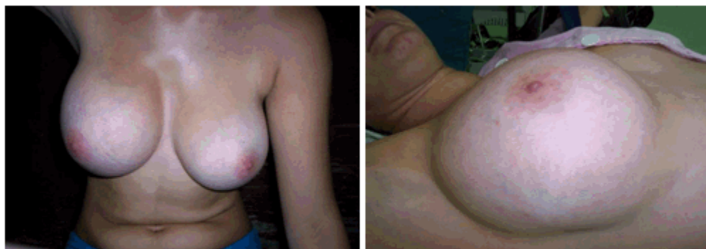
Figura 1. Tumor que ocupaba toda la mama derecha Figura 2. Vista lateral de la gran tumoración

Al examen físico se constataba la presencia de una gran tumoración que ocupaba prácticamente toda la mama derecha, con dilatación de las venas superficiales. No se palpaban adenopatías axilares homo ni contralaterales, tampoco existía fijación a la piel ni a planos profundos ni telorragia. (Figuras 1 y 2).