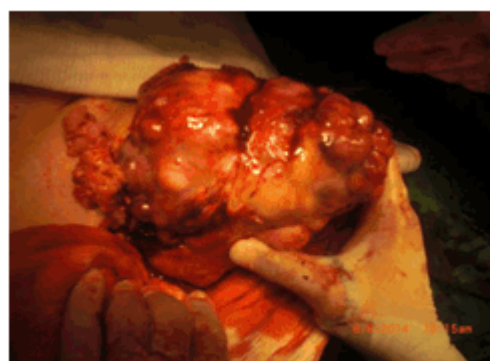
Figura 3. Acto quirúrgico. Extracción del tumor de 15 x 19 cms

Informe operatorio: se comprobó la existencia de un tumor sólido que emergía de la raíz del mesenterio y desplazaba las asas intestinales y colon. Poseía irrigación de intestino delgado y grueso. Se realizó exéresis y se resecó el meso adjunto. Se envió al departamento de anatomía patológica. No se detectan ganglios patológicos ni metástasis en hígado. (Figura 3).