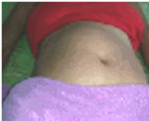
Figura 1. Abultamiento del hemiabdomen derecho

Se decidió proceder al ingreso de la paciente con síndrome tumoral abdominal para realizar estudio.