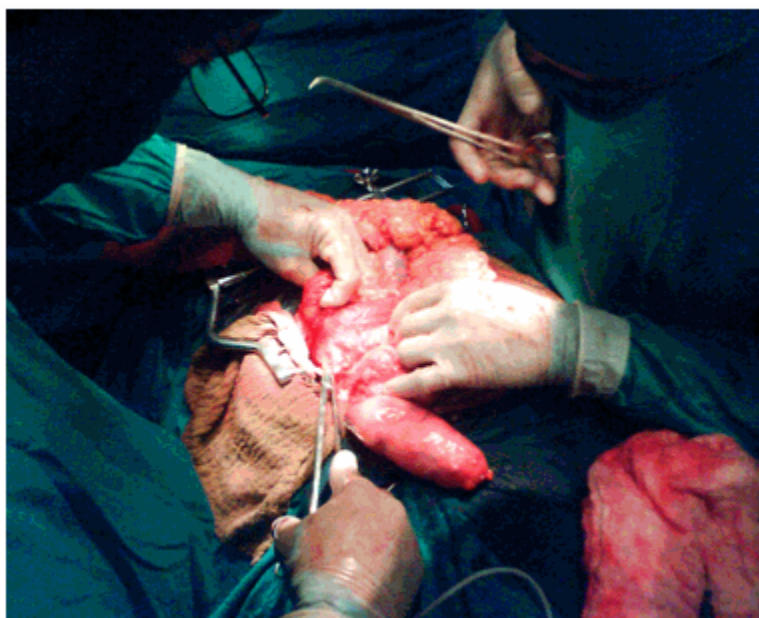
Figura 2: Momentos del inicio de la hemicolectomía

El departamento de anatomía patológica informó la presencia de un adenocarcinoma de la base del apéndice.