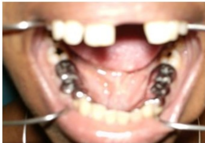
Figura 8. Instalación de la férula metálica para levante de mordida

días hasta que la paciente estuvo recuperada para comenzar así el tratamiento ortodóncico. (Figuras 8 y 9).