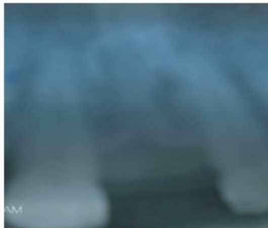
Figura 4. Rayos X periapical

llegaba hasta el límite entre el tercio medio y el tercio apical del 11 y el 21. Diastema de más de 9 milímetros. (Figura 4).