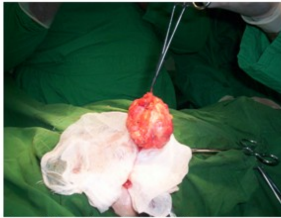
Figura 3. Tumor luego de su exéresis