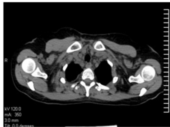
Figura 3. TAC de tórax muestran adenopatías mediastino superior

Biopsia 16B-1185. Se recibieron varios fragmentos del cuello uterino. Muestras constituidas en su totalidad por tumor.