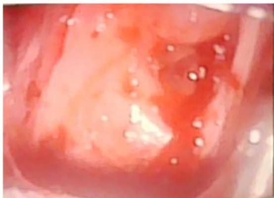
Figura 1. Colposcopia que muestra características tumorales del cuello

En la interconsulta con especialista de onco-ginecología se detectó: útero aumentado de tamaño unos 12 cms, pétreo, de superficie irregular. Los anejos no se definieron. Tacto rectal (TR): la pared anterior del recto estaba algo pétreo e impresionaba proximidad con el útero. Ambos parametrios se encontraban infiltrados hasta la pared. Colposcopia: cuello uterino con pérdida de su estructura normal. Gran distorsión de las células. Presencia de mosaicos. Lesión exofítica que prorrumpía por el canal cervical con fetidez (necrosis tumoral). El tumor ocupaba todo el orificio cervical y el canal. Se tomaron ponches de todas las áreas del cérvix que sangran fácilmente para estudio histopatológico. ID: cáncer del cuello uterino estadio IV. (Figura 1).