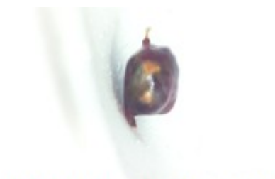
Figura 2. Se observa lesión de bordes bien definidos encapsulada de color negro

Técnica quirúrgica: con el paciente colocado en posición de plegaria mahometana modificada, se realizó asepsia y antisepsia, se colocaron paños estériles. Se planeó una incisión dorsal media desde D12 a L4, que se delimitó con comprobación radiológica y se procedió a incisión definitiva, se practicó desinserción de la musculatura paravertebral de manera estándar y se efectuó esqueletización y laminectomía del arco vertebral de L2. Se ejecutó durotomía y se visualizó una lesión que guardaba relación con raíces nerviosas a ese nivel, encapsulada, de color negro, se procedió con rizotomía, cauterizando en ambos extremos de la raíz y se realizó exéresis total de la lesión. Se realizó cierre dural, cierre por planos y se colocó drenaje de la herida. En el acto quirúrgico se siguieron todos los protocolos establecidos para la cirugía de pacientes con diagnóstico de VIH. Se envió la muestra a anatomía patológica para que fuera analizada. (Figura 2).