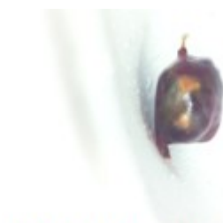
Figura 2. Se observa lesión de bordes bien definidos encapsulada de color negro

Técnica quirúrgica: con el paciente colocado en posición de plegaria mahometana modificada, se realizó asepsia y antisepsia, se colocaron paños estériles. Se planeó una incisión dorsal media desde D12 a L4, que se delimitó con comprobación radiológica y se procedió a incisión definitiva, se practicó desinserción de la musculatura paravertebral de manera estándar y se efectuó esqueletización y laminectomía del arco vertebral de L2. Se ejecutó durotomía y se visualizó una lesión que guardaba relación con raíces nerviosas a ese nivel, encapsulada, de color negro, se procedió con rizotomía, cauterizando en ambos extremos de la raíz y se realizó exéresis total de la lesión. Se realizó cierre dural, cierre por planos y se colocó drenaje de la herida. En el acto quirúrgico se siguieron todos los protocolos establecidos para la cirugía de pacientes con diagnóstico de VIH. Se envió la muestra a anatomía patológica para que fuera analizada. (Figura 2).