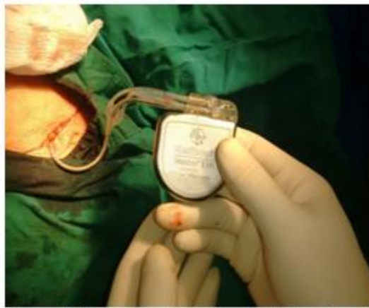
Figura 2. Generador conectado a electrodos antes de introducirse en el bolsón

Posterior al implante se realizó rayos x de tórax