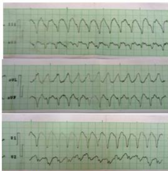
Figura 1. Registro eléctrico donde se constata taquicardia ventricular monomórfica

La taquicardia ventricular se asistió con desfibrilación, por lo que se logró la reversión al ritmo sinusal, y el paciente evolucionó de manera favorable, luego se comenzó tratamiento con amiodarona.