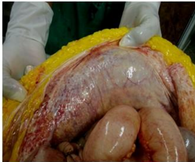
Figura 2. Aspecto del peritoneo parietal

ml en cavidad abdominal. El peritoneo parietal engrosado infiltrado por proceso tumoral, tal como se muestra. (Figura 2).