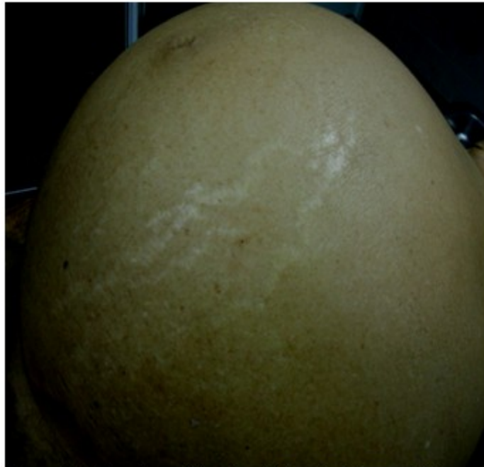
Figura 1. Hábito externo del cadáver. Nótese al abdomen globuloso y la ictericia, más evidente hacia la porción abdominal inferior

abdomen globuloso y renitente con presencia de onda líquida. (Figura 1).