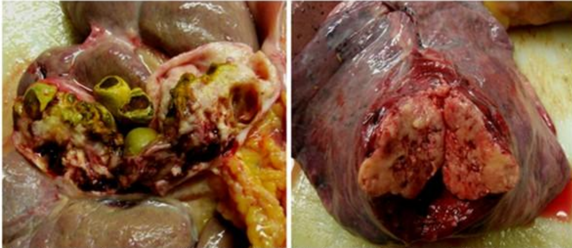
Figura 3. Izquierda: Aspecto macroscópico de la vesícula biliar; Obsérvese las litiasis y las características tumorales de la mucosa y de la pared del órgano. Derecha: masa tumoral metastásica en BPD

como se muestra, además de metástasis hepáticas y ganglionares. Dentro de otros hallazgos de interés se demostró una traqueobronquitis aguda purulenta que constituyó la causa directa de muerte. (Figura 3).