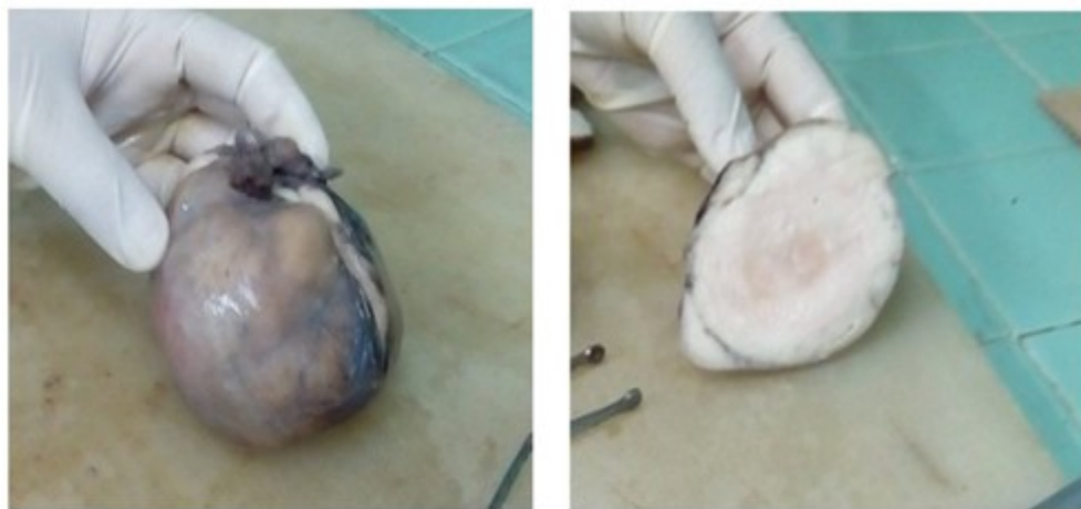
Figura 1. Aspecto macroscópico superficial y al corte

En el análisis de la pieza 1 se observó que estaba rotulada como ovario derecho tumoral. La muestra midió 8 x 7 cm en sus diámetros mayores con un peso de 400 gramos. Aspecto polilobulado y sólido. Superficie lisa blanco amarillento. Al corte blanquecino homogéneo. (Figura 1).