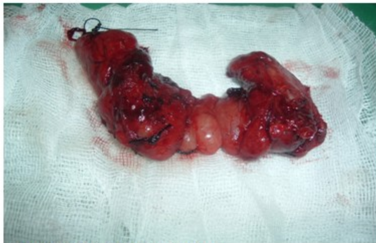
Figura 3. Pieza quirúrgica (tiroides total)

puede ser primaria de tiroides, aunque debe descartarse lesión primaria en mama, pulmón y colon principalmente. (Figura 3).