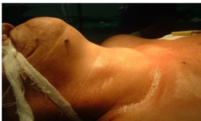
Figura 1. Paciente en posición quirúrgica

Se presenta el caso de una paciente de 66 años de edad, de color de piel blanca, con antecedentes de padecer cardiopatía isquémica e hipertensión arterial, para lo cual llevaba tratamiento médico. Acudió a consulta con aumento de volumen en la región anterior del cuello hacía varios meses, acompañado de decaimiento, palpitations y en ocasiones disfgia a los alimentos sólidos. Al examen físico se constató una tumoración que ocupaba casi todo el lóbulo derecho, correspondiendo con nódulo de aproximadamente 4 cm. de diámetro, móvil con la deglución. (Figura 1).