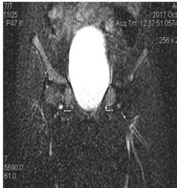
Figura 2. RMN de pelvis. Presencia de testes en ambos canales inguinales

Se observó ausencia de útero y anejos. Permeabilidad a nivel de los genitales externos,