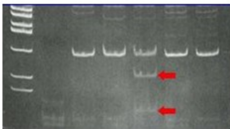
Fig. 2. Resultado del estudio molecular a través del que se identifica la mutación G1138A en el gen FGF3 en la acondroplasia

Con respecto a su causa, la mayoría fueron monogénicos de transmisión más frecuente autosómica dominante (55 % del total).