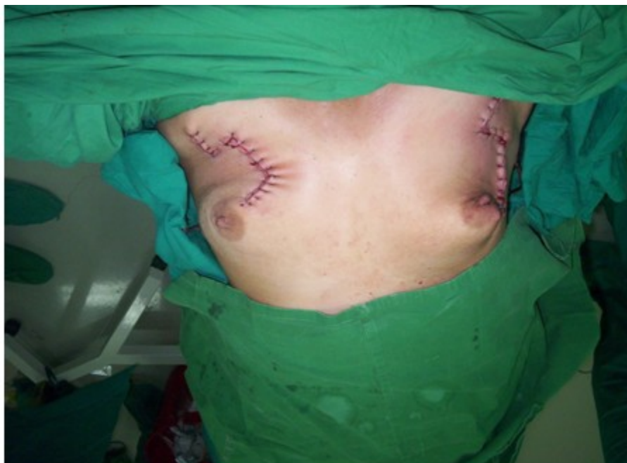
Figura 2. Cirugía conservadora bilateral.