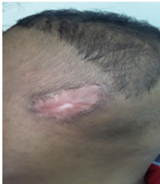
Figura 3. Paciente con 2 meses de operado