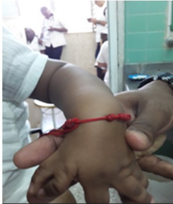
Figura 2. Presencia de polidactilia en la mano izquierda