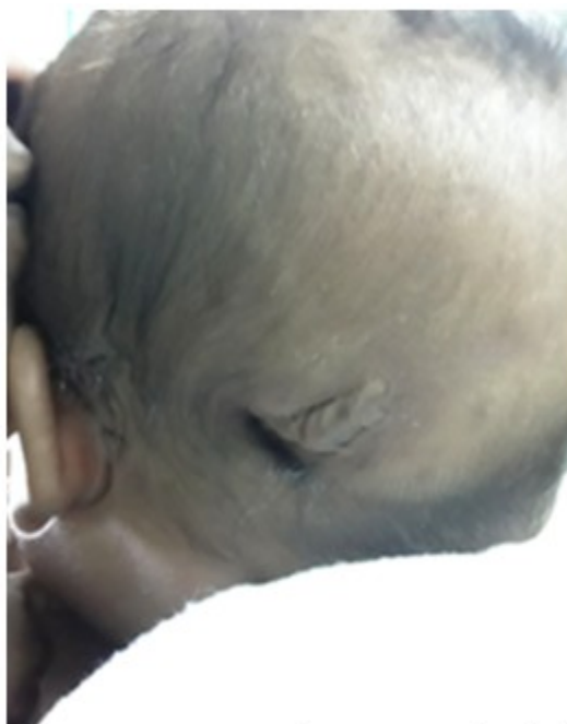
Figura 1. Lactante de 5 meses de edad con diagnóstico de aplasia cutis congénita

Al nacer se le diagnosticó una aplasia cutis congénita (ACC) con defecto óseo. Se solicitó interconsulta con el Servicio de Neurocirugía, se ingresó en el Servicio de Neonatología y a las 3 horas de nacido comenzó con convulsiones, iniciándose tratamiento con fenobarbital. Requirió ventilación mecánica durante 72 horas, presentó una hemorragia intraventricular Grados 1-2 y una enfermedad de la membrana hialina Grado 2-3, además presentó un íctero fisiológico agravado, por lo cual requirió fototerapia y transfusión en 2 ocasiones. El paciente permaneció hospitalizado 45 días, pendiente de tratamiento neuroquirúrgico para la corrección del defecto óseo y seguimiento en consulta de neurodesarrollo. (Figura 1).