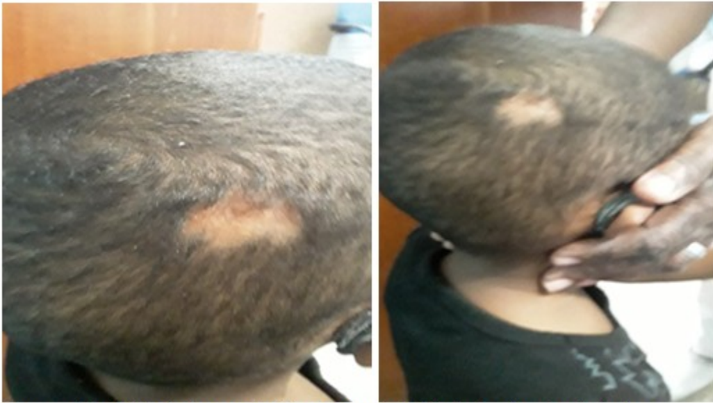
Figuras 4 y 5. Paciente con lesión en cuero cabelludo desde el nacimiento