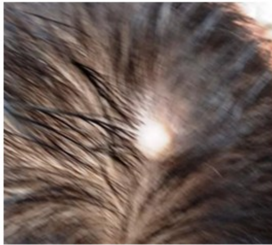
Figura 6. Recién nacido 15 días con ACC