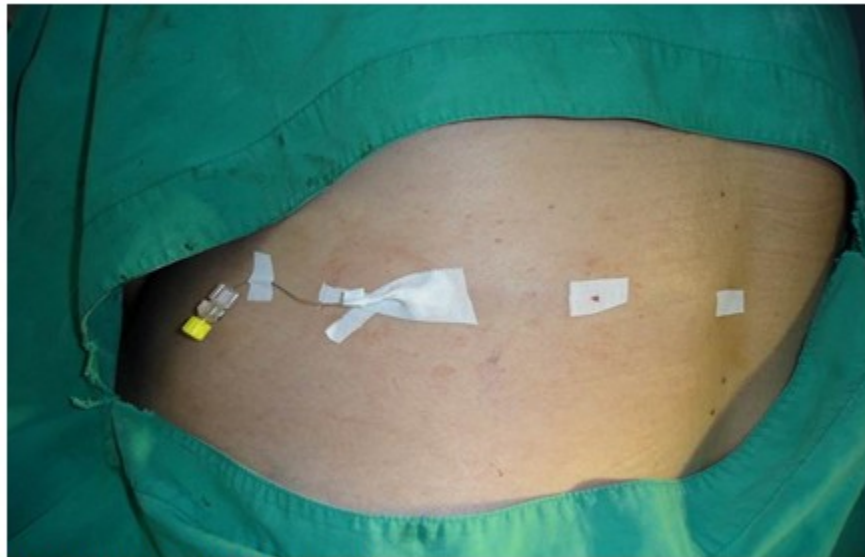
Fig 2. Catéter epidural tunelizado

administración de morfina. Resultados publicados en la Revista Electrónica de Biomedicina Española. (Fig 2).