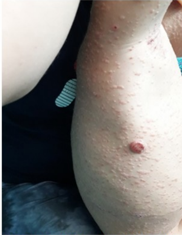
Fig 3. Se observaron algunos tumores eritematosos pequeños

Además, aparecieron algunos tumores eritematosos pequeños como el observado en cara interna del muslo izquierdo y región lateral del tronco. (Fig 3).