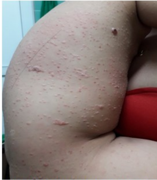
Fig 1. Se observaron lesiones en placa eritematopapulosas no infiltradas

Este cuadro cutáneo se extendió a las extremidades inferiores y región genital,