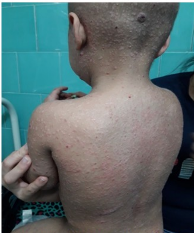
Fig 4. Lesiones diseminadas a sólido, de 6x8 mm localizadas en el cuero cabelludo

Luego de discutir el caso con el Servicio de Hematología se realizó biopsia cutánea con los diagnósticos presuntivos de leucemia cutánea, infiltración maligna a piel y erupción liquenoide por fármacos. El estudio histopatológico confirmó el diagnóstico de leucemia cutánea y se inició el tratamiento según protocolo por la especialidad de hematología pediátrica.