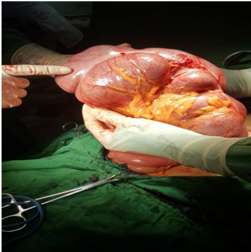
Fig. 2. Vólvulo de ciego diagnosticado en el acto operatorio

A la paciente intervenida se le realizó una hemicolectomía derecha con una