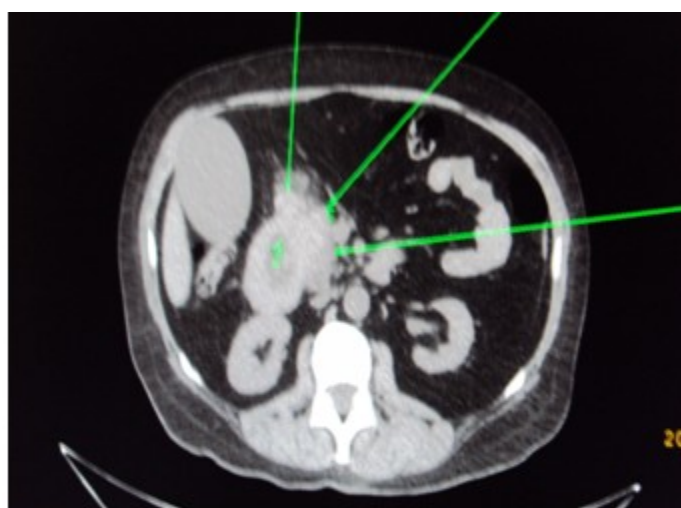
Figura 2. En la TAC se muestra la imagen tumoral que estenosa el duodeno y la dilatación de vías biliares intra y extrahepáticas. Corte transversal.