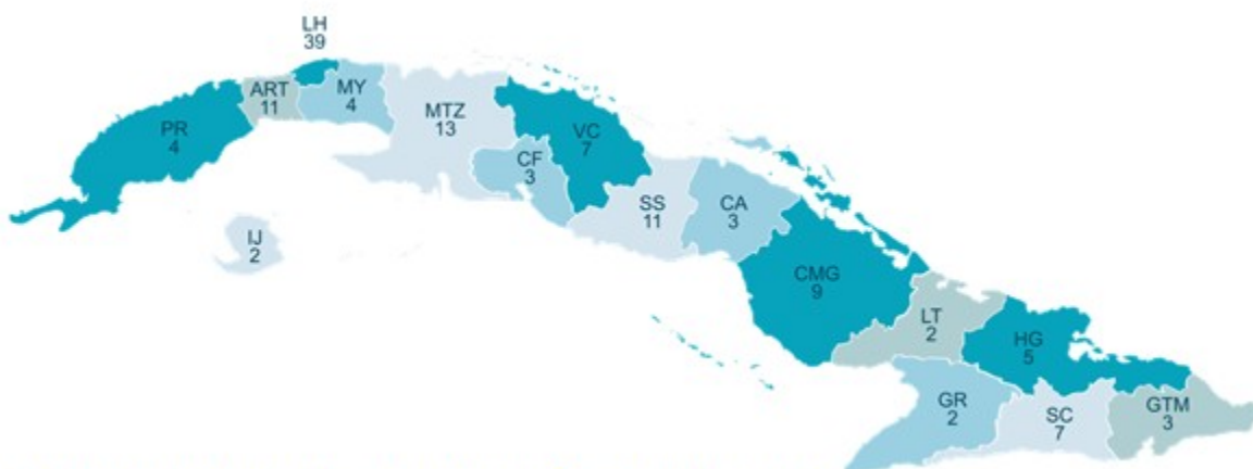
Fig.1. Distribución de casos con defectos congénitos del SNC según provincias del país

De las 125 embarazadas estudiadas con defectos congénitos del SNC, 29 (23,2 %) tenían 19 o menos años y 6 (4,8 %) con 37 o más años de edad. Con relación a la edad gestacional del diagnóstico en 70 casos (56,0 %) se realizó entre las 14 y 27,6 semanas y en 54 (43,2 %) con 28 o más semanas de gestación. Se observa a continuación un mapa donde aparecen la distribución de las embarazadas, de acuerdo a su procedencia; 72 de ellas (56,8 %) del total eran de la región occidental; 39 de ellas (31,2 %) residían en la Habana. (Fig. 1).