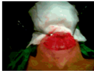
Figura 2. Tumor del cuello expuesto

Se procedió a la intervención quirúrgica de la paciente con exéresis de la tumoración, que fue informada por el departamento de anatomía patológica como un bocio multinodular. (Figuras 2, 3, 4,5).