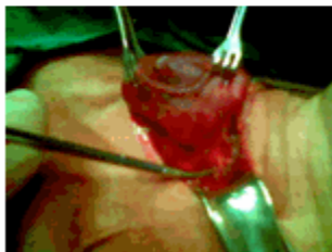
Figura 4. Resección de la prolongación mediastínica