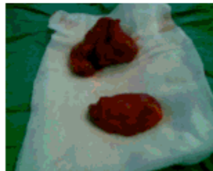
Figura 5. Ambas tumoraciones resecaadas