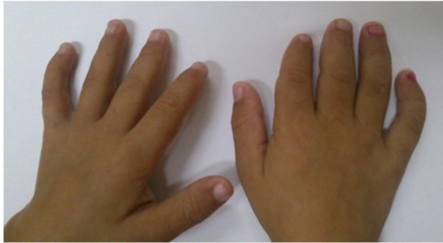
Fig. 4. Clinodactilia bilateral del 5to dedo

A nivel de las extremidades se observó clinodactilia bilateral del 5to dedo. (Fig. 4).